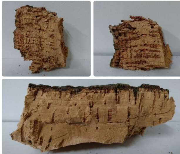
Figura 4 alcuni campioni di sughero estratto per la valutazione qualitativa

Dal punto di vista della qualità della materia da estrarre, dall'esame visivo nonché delle misurazioni dello spessore del sughero portato dalle piante esaminate, si ritiene che la qualità più diffusa è classe II. È escluso il calcolo del "rialzo" dell'altezza di decortica delle piante già messe a coltura, in quanto irrilevante.