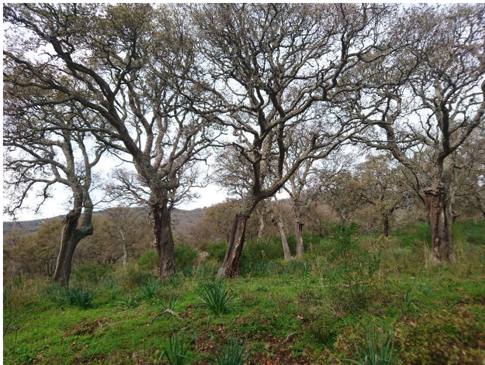
Figura 2 alcune sughere dell'area interessata

Le piante di sughera presenti in queste località sono 900 di cui 240 piante in produzione e il resto piante in cui bisogna eseguire la demaschiatura.