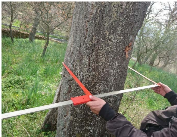
Figura 3 operazioni di misurazione con calibro dendrometrico